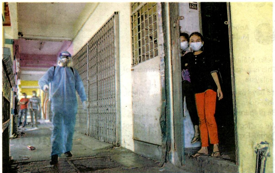
KAKITANGAN Jabatan Kesihatan Majlis Perbandaran Klang melakukan operasi disinfeksi di Kompleks Pasar Besar Jalan Meru, Klang kelmarin.

Jelas beliau, kenyataan Ketua Pengarah Kesihatan, Tan Sri Dr. Noor Hisham Abdullah kelmarin