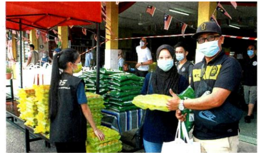
A couple collecting their food basket during the distribution at SM Agama Batu Belah in Kampung Batu Belah, Klang.