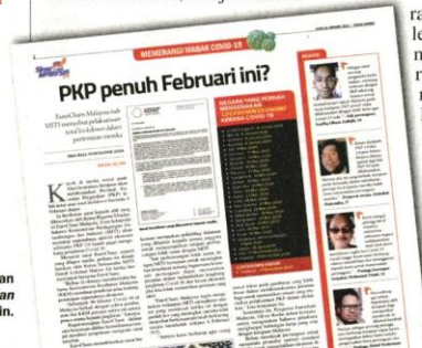
Laporan Sinar Harian pada Isnin.

Dalam kenyataan sama, beliau berkata, pandangan orang awam adalah cadangan yang terbaik untuk pembinaan negara dan harus diterima oleh semua pihak.