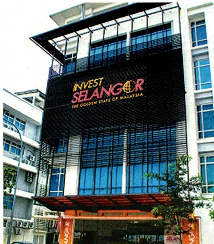
INVEST Selangor dan SIDEK Sdn. Bhd. bekerjasama menganjurkan Selangor E-Bazar sempena Tahun Baru Cina untuk menggalakkan digitalisasi dalam kalangan PKS. - GAMBAR HIASAN

Kempen yang diselenggarakan bersama Invest Selangor Berhad dan Selangor Information Technology and Digital Economy Corporation (SIDEK) Sdn. Bhd.